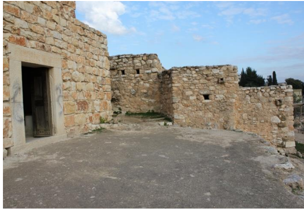
Aspecto exterior de las casas en los tiempos de Jesucristo.

Las casas de los más ricos eran de piedra y argamasa. Las habitaciones se distribuían alrededor de un patio central. A veces disponían de un piso, la “habitación alta” que se reservaba para los invitados de paso. Esas casas poseían cisternas y baños. También calefacción central, con un sistema de cañerías de agua o aire calientes procedentes de un fogón. En época de Jesús hubo gran influencia de la arquitectura romana, sobre todo entre las clases pudientes.