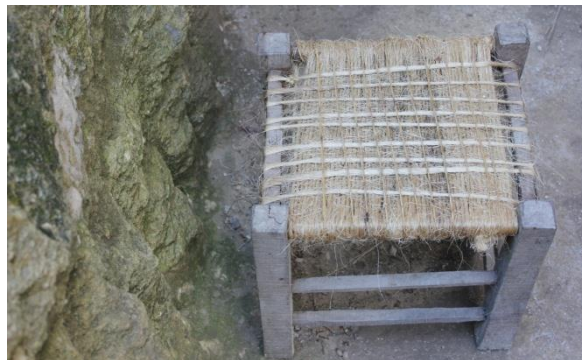
Banco de madera del siglo I